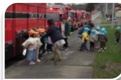
→火災予防広報の様子

4月20日(土)から30日(火)まで春の火災予防運動が行われました。火災予防運動期間中には消防車両7台による市中パレードが実施されたほか、こども園の園児と記念撮影をするなど、火災予防を呼びかけました。また、女性消防団員による火災予防街頭PRも行われました。