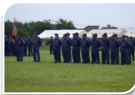
→連合演習に参加する消防団員

7月7日(日)に雄武町のメモリアル広場で第53回紋別分会連合消防演習が行われ、滝上消防団からは22名が参加しました。紋別市・滝上町・興部町・西興部村・雄武町の5市町村から消防団員が集結し、日頃の消防訓練の成果を披露すると共に防火意識の更なる高揚を図ることができました。