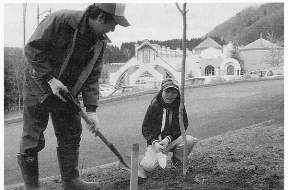
早く大きくなるといいね!