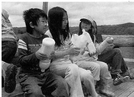
作りたてのバターは最高です

◇おいしいバターづくり 6月7日に町内の金子牧場でわんぱく専科「酪農見学」が行われました。参加した子ども達は、元氣いっぱい牧場の中を歩いたり、牛に触ったりと楽しんでいました。また、新鮮な牛乳をペットボトルに入れ、手作りバターに挑戦。子ども達は牧場ののどかな風景を見ながら一生懸命ペットボトルを振っていました。出来上がったバターは、滝上産小麦を使用した金子さんの自家製パンに塗っておいしくいただきました。 「牛に触れて嬉しかった」「手作りバター、パンがとても美味しかった」と、子ども達は牧場のひとときを満喫したようです。