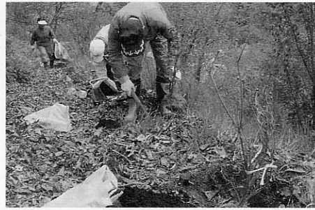
来春が楽しみです

5月21日、滝上公園東口登り口から頂上にかけての沿道（末広観光ホテル前）に「エゾムラサキツツジ」と「レンゲツツジ」100本の植栽を行いました。