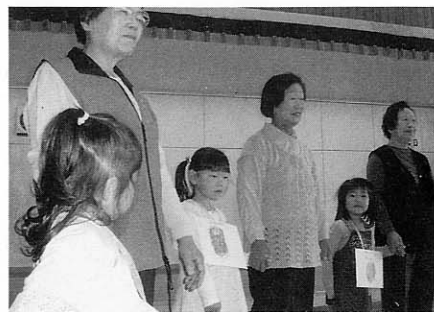
子ども達も大喜びでした

◇可愛い子ども達と交流 ことぶき専科「幼稚園児との交流会」が5月27日に幼稚園で開催されました。楽しいレクリエーションや手遊び、フォークダンスを通して子ども達と交流を深めました。 ことぶき専科の皆さんは、可愛い子ども達からたくさん「元氣」をもらっていたようです。