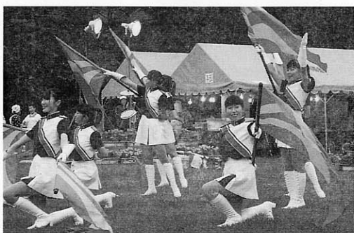
道警音楽隊・カラーガード隊演奏会