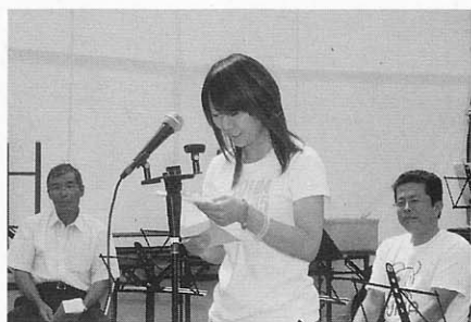
小学校1年生の時に父さんに書いた手紙を朗読しました

また、会場の一面には、昭和町内会が出現、昭和時代にタイムスリップ。昔の町並みを再現し「紙芝居」「射的」「かたぬき」「駄菓子」などの店が開店、また食堂では「でんぶんかき」「いもだんご」などの昔なつかしい料理も提供され、会場では、昔を懐か