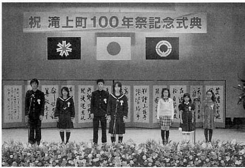
小・中・高校生が町民憲章を朗唱