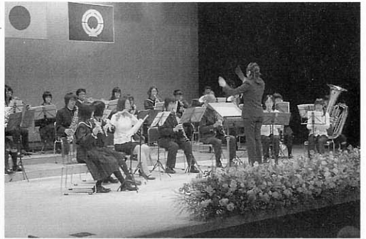
滝上中学校吹奏楽部などによる吹奏楽演奏