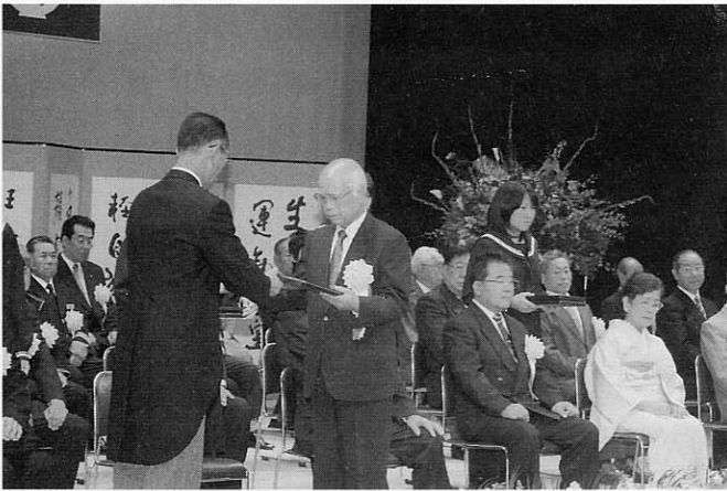
功 労 表 彰

功労表彰では、町の発展に尽力された方々がステージに上がり、一人ひとりに表彰盾が手渡されました。（関連記事Ⅱ町長室へようこそNO・15）