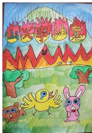
濁川小学校5年 関町 凧