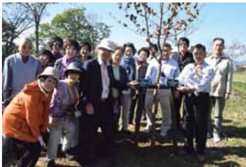
昨年行われたエゾヤマザクラの植樹活動