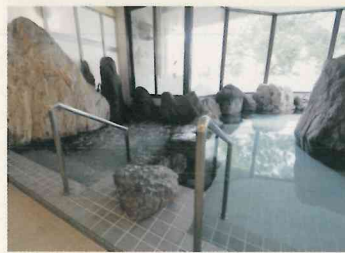
童話村たきのうえ ホテル溪谷