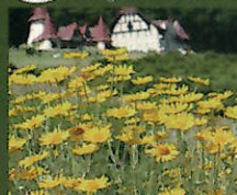
カモミール、モナルダ、アリウム