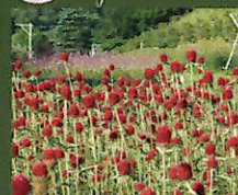
ホップ、センニチコウ、バラ、アナベル