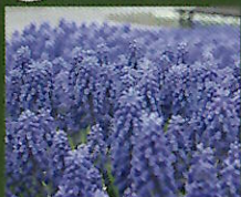
ムスカリ、チューリップ、すいせん