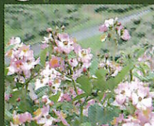
サクラバラ、ルピナス