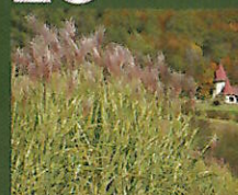
ギンドロヤナギ、ルテウス、タカノハススキ